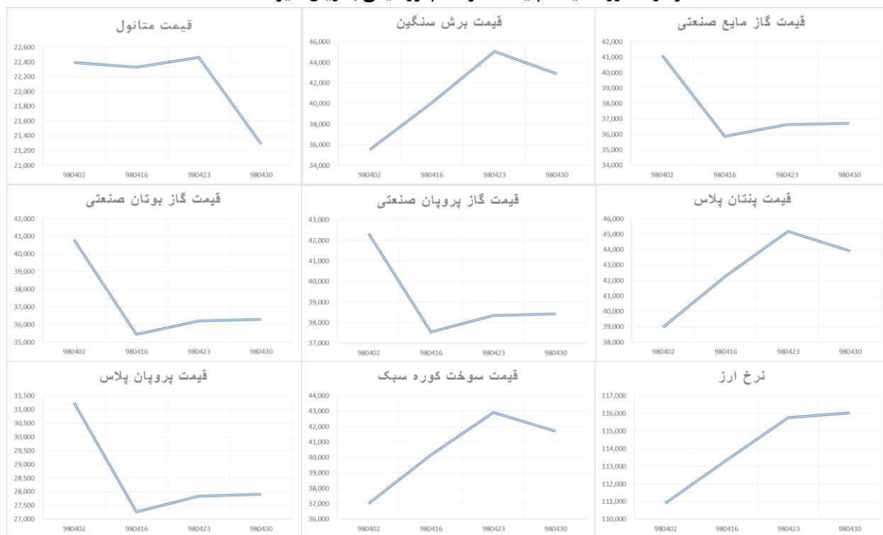
نمودار ۳- روند قیمت پایه محصولات پتروشیمی به ریال (تیرماه ۱۳۹۸)